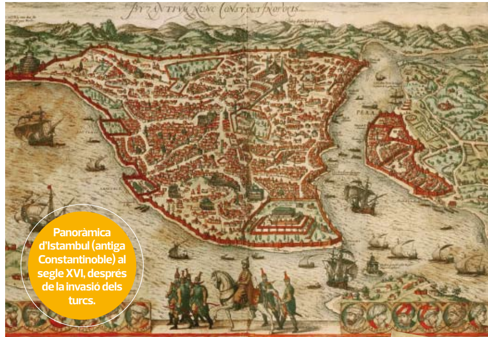
Panoràmica d'Istanbul (antiga Constantinoble) al segle XVI, després de la invasió dels turcs.

La nouvelle conjuga les referències a aquest marc històric tan suggestiu amb el relat de la peripècia personal de l'artista. Tot d'enumeracions d'elements diversos us faran penetrar de manera agradable en l'època. Enard s'empesca un final amb suspens i no ha deixat passar l'oportunitat de tenir la seva narració amb un lirisme que els seguidors d'Omar Khayyam o dels poetes andalusins reconeixen fàcilment. La reflexió del protagonista sobre la pràctica de l'art és present en molts passatges de la novel·la: