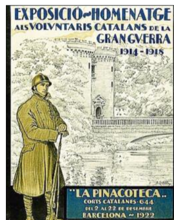
Cartell en suport dels voluntaris

La impossibilitat de consultar els arxius de la Legió Estrangera, ara mateix vetats als estudiosos, posen en quarantena qualsevol intent d'establir una xifra aproximadament definitiva sobre la quantitat de catalans que van lluitar a la Gran Guerra, ja que «podria incrementar-se». No obstant això, «la xifra de 950 casa bastant amb el