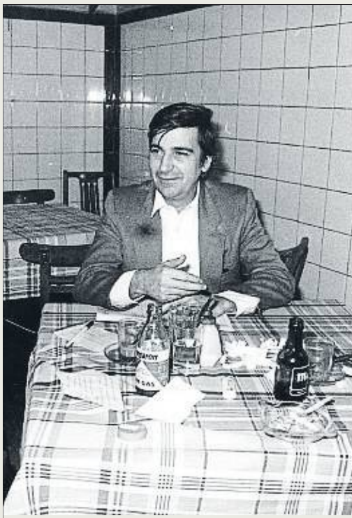
Ernest Lluch en un restaurante en Madrid

En este contexto de buenas voluntades, el PSC-C pidió constituir un grupo propio que se reguló de mane-