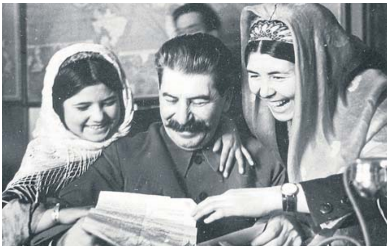
Després de la Segona Guerra Mundial i la mort de Joseph Stalin (a la foto), els seus hereus van tornar a reconèixer la importància de les diverses ètnies de la Unió Soviètica.