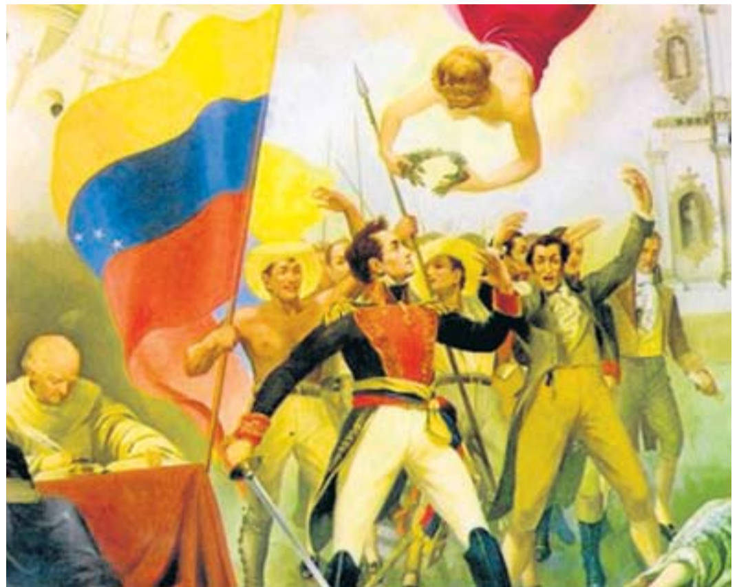
Simón Bolívar va ser un militar decisiu en les independències de les actuals Colòmbia, Equador, Panamà, Perú, Veneçuela i Bolívia, país que deu el nom al seu alliberador.

En aquesta línia, deu anys després, el procés ja no tenia aturador i, del Virregnat del Perú, la Capitania General de Guatemala i la província Charcas del Virregnat del Riu de la Plata en naixerien els futurs