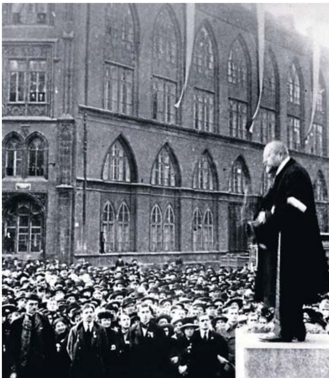
Antonin Nemeč, dirigent del partit socialdemòcrata, pronuncia un discurs a Praga en una trobada per celebrar la independència de Txecoslovàquia l'any 1918.

En el marc de la Conferència de Pau de París, en la primera meitat de l'any 1919, i per mitjà de tractats posteriors, les anteriors independències van quedar segellades i Austrohongria va desaparèixer. Mirant enrere, més d'un podia riure per sota el nas pensant en el lema de la monarquia dual: "Indivisible i inseparable".