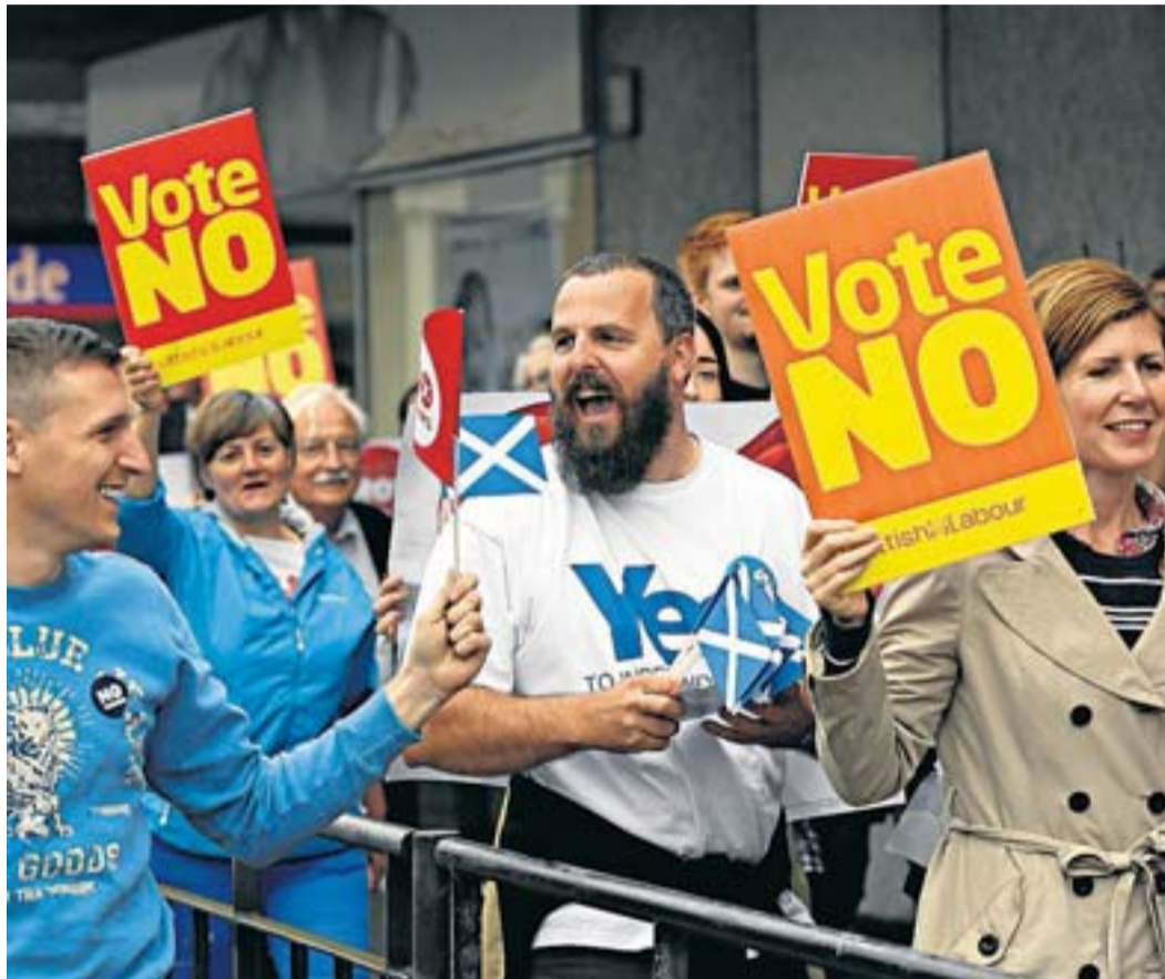
Els partidaris del no van combinar, en la campanya pel referèndum, l'estratègia de la por amb aparicions de personatges britànics que expressaven l'afecte per Escòcia.

El Partit Nacional Escocès (SNP) va aparèixer als anys trenta, però el nacionalisme escocès no va guanyar relleu fins als anys seixanta. A partir d'aquí va començar un llarg procés per obtenir l'anomenada devolution , la transferència de competències. A Escòcia, l'any 1979 els mateixos escocesos van votar-hi en contra quan van ser consultats. No va ser fins al 1997 que el vot favorable a la devolution es va imposar en un segon referèndum i el 1999 va escollir-se el primer Parlament escocès amb algunes competències (més ben delimitades però no pas tan àmplies com en el cas català, per exemple). En quinze anys l'SNP, de centreesquerra, s'ha consolidat com el partit hegemònic i ha obtingut el mandat ciutadà per governar i convocar un referèndum d'independència.