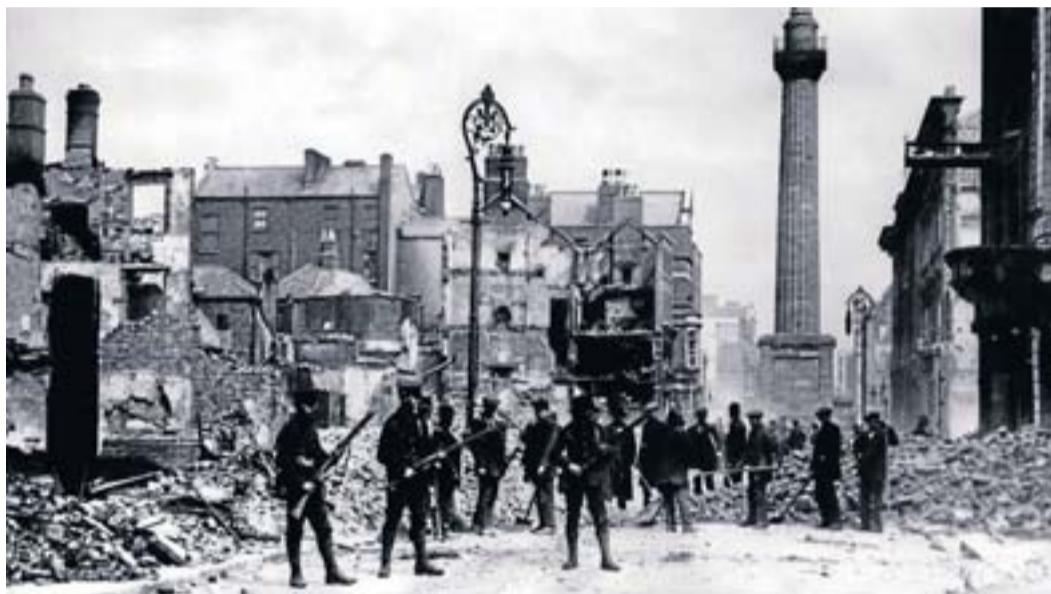
L'Alçament de Pasqua del 1916 va ser reprimit amb duresa per les tropes britàniques.

La primavera de 1916, un grup d'independentistes va proclamar la República d'Irlanda. L'episodi, l'Alça-