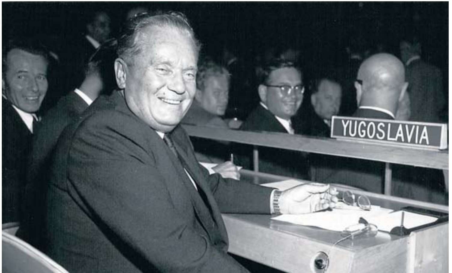
Josip Tito, president de la República de Iugoslàvia, en una assemblea de l'ONU el 1960.

Amb la derrota de Hitler, es va establir la República Federal Socialista de Iugoslàvia, presidida per Josip Tito, amb sis repúbliques: Bòsnia i Hercegovina, Croàcia, Macedònia, Montenegro, Eslovènia i Sèrbia, amb les seves dues províncies autònomes, Kosovo i la Voivodina. El