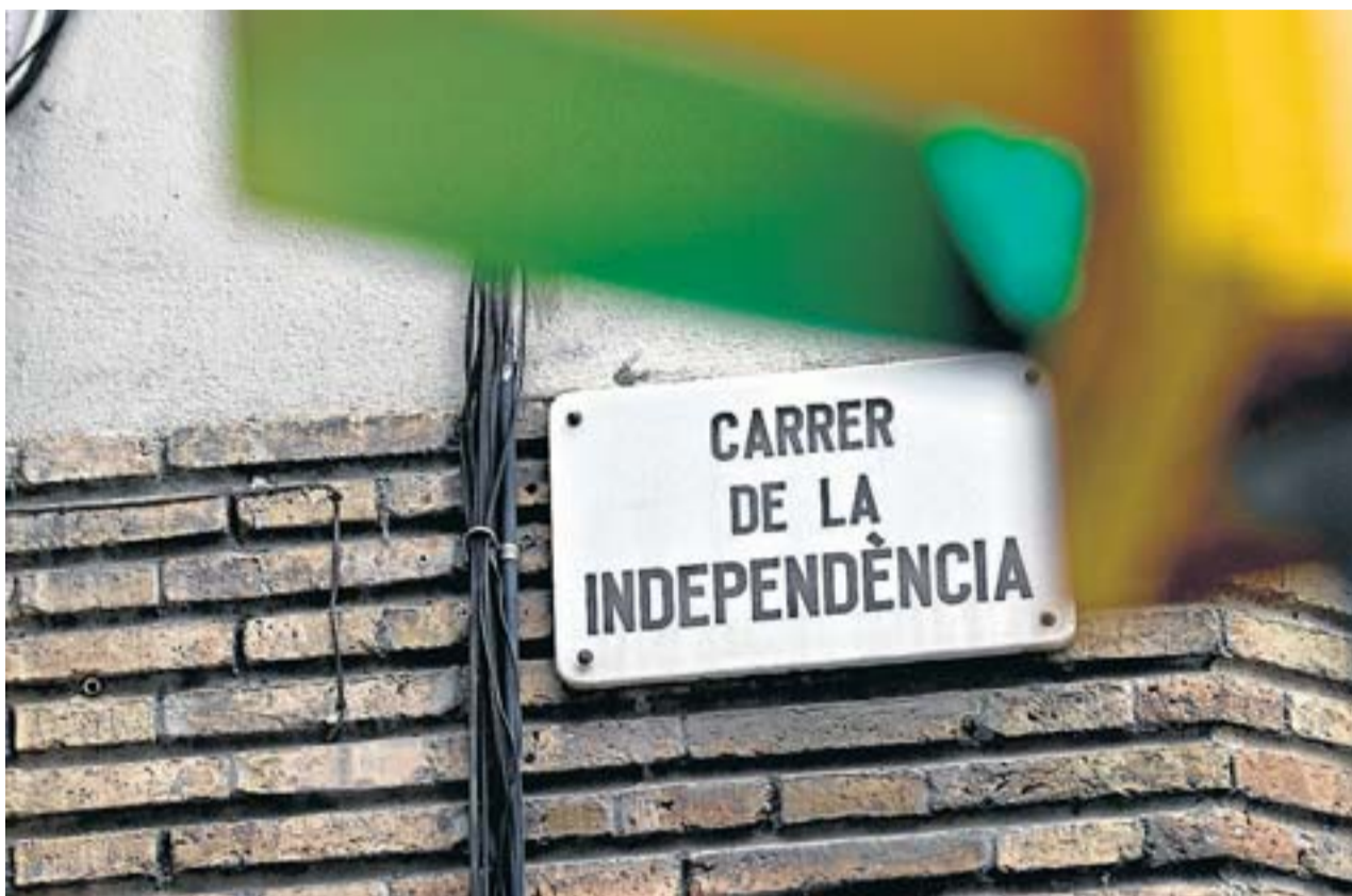
La visió que es tenia del concepte teòric canvia a partir del 1776, quan les tretze colònies americanes van votar dissoldre els seus vincles amb l'Imperi Britànic. XAVIER BERTRAL

01 I demà La independència dels Estats Units