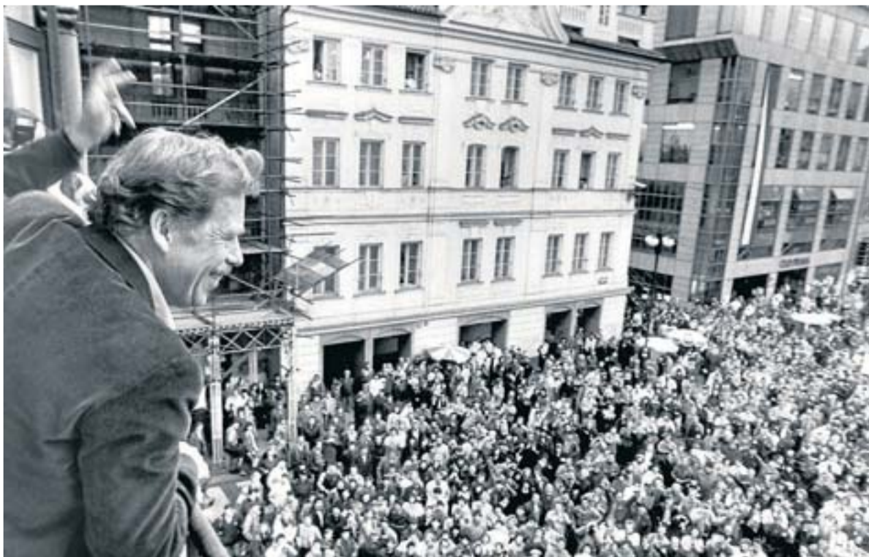
Václav Havel, a la fotografia saludant els seus seguidors, va ser l'últim president de Txecoslovàquia i el primer president de la República Txeca. Escriptor i dramaturg, va morir el 2011.

A tot això s'hi va afegir que els polítics eslovacs desitjaven una federació més laxa, el contrari que els txecs. Després de diversos intents per negociar una solució, el Parlament eslovac va declarar la independència a finals del 1992. No es va preguntar a la població ni en un referèndum, ni en cap mena d'eleccions. Els polítics de les dues bandes van acordar la dissolució del país i cap part no se'n va declarar hereva. Les enquestes apuntaven que només el 30% dels ciutadans eren favorables a la independència. Per a molts, es tracta d'un exemple que els models federals no són la solució a tots els mals d'un estat.