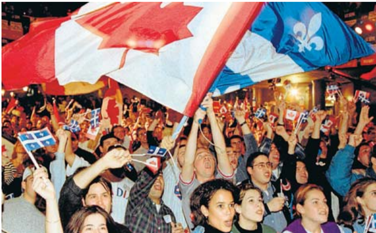
Al Quebec sembla que les ànsies d'independència han passat i hi ha qui vincula aquest aparent retrocés a la consolidació del francès com a llengua d'ús i d'accés a la feina.