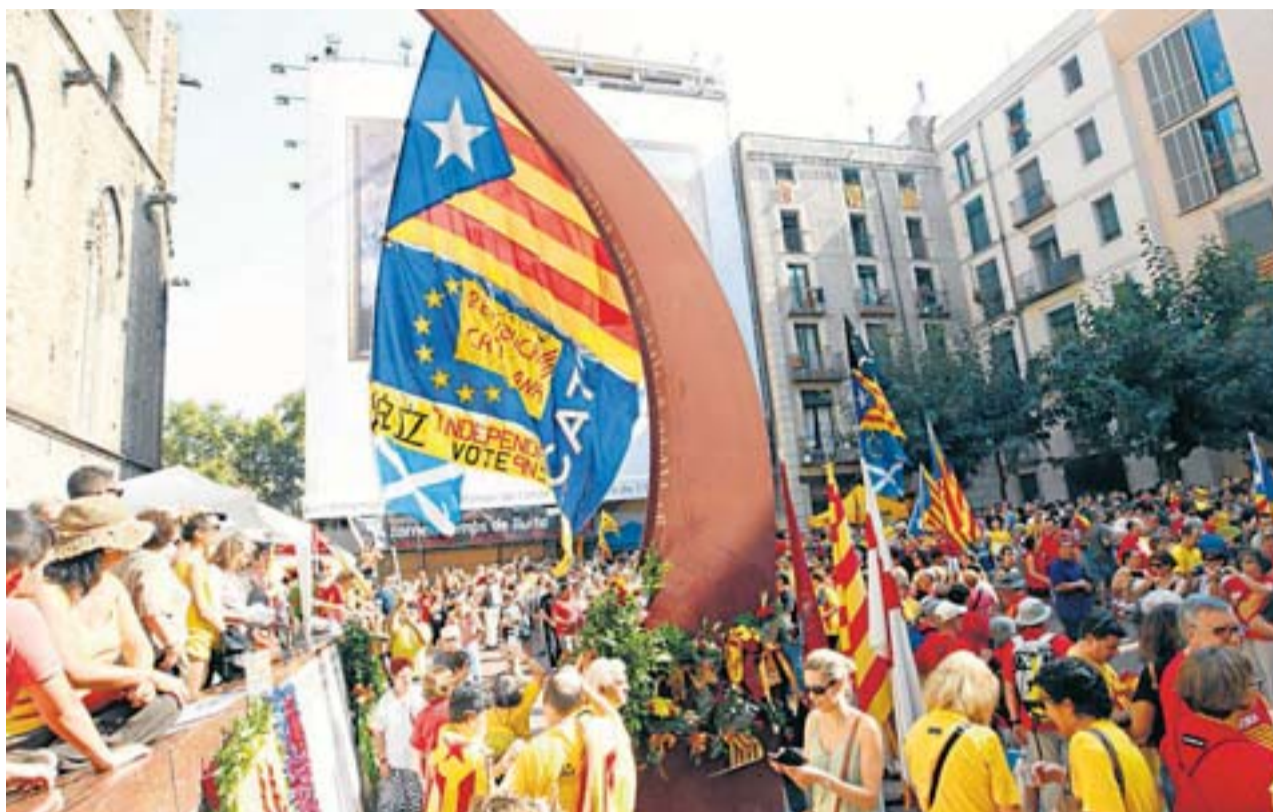
Des del 2012 les mobilitzacions de ciutadans de Catalunya per reclamar la independència han sigut constants i multitudinàries. A la foto, el Fossar de les Moreres l'Onze de Setembre del 2014. XAVIER BERTRAL