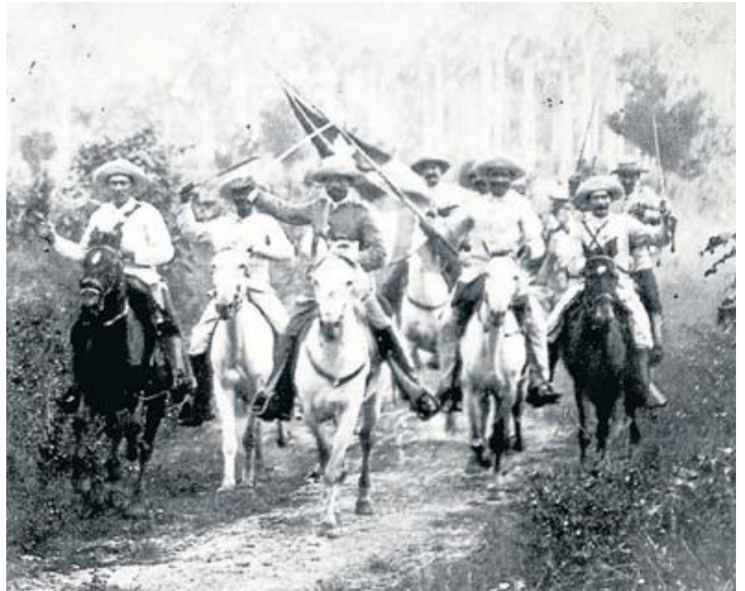
La guerra entre partidaris de la independència i l'exèrcit espanyol va acabar amb triomf dels conqueridors, però la disputa va servir per refermar la identitat cubana. VIQUIPÈDIA

L'enfonsament del cuirassat Maine a la badia de l'Havana el febrer d'aquell any va servir d'excusa a Washington per entrar en la guerra ajudant els rebels, i per atacar també les possessions espanyoles a Puerto Rico i les Filipines. L'agost de 1898 la guerra va acabar amb la derrota de