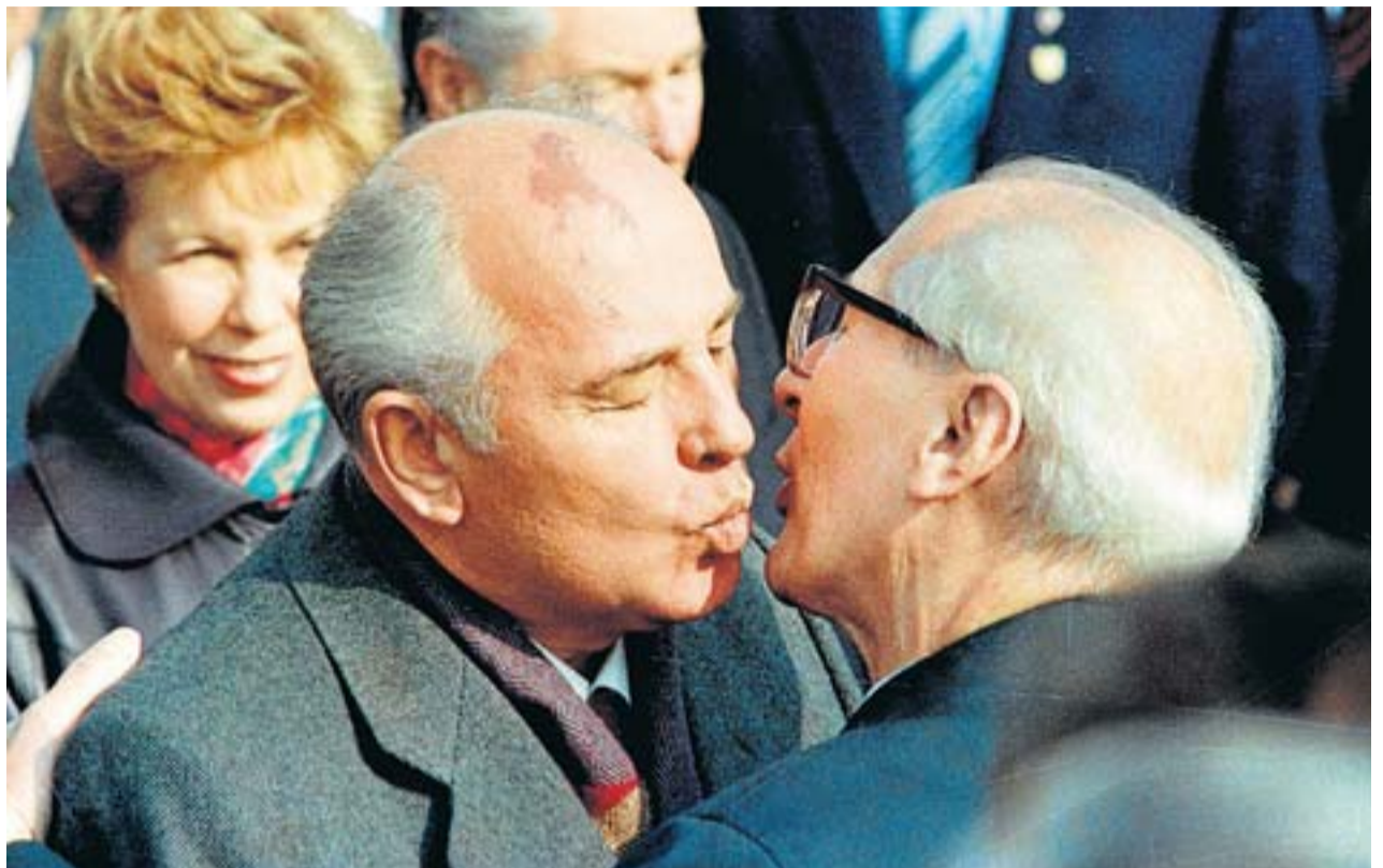
Imatge del famós petó el 1989 entre el president de l'URSS, Mikhaïl Gorbatxov, i el de la República Democràtica Alemanya, Erich Honecker, poc abans de la caiguda d'aquest segon i del Mur de Berlín.

13 I demà el trencament de Txecoslovàquia