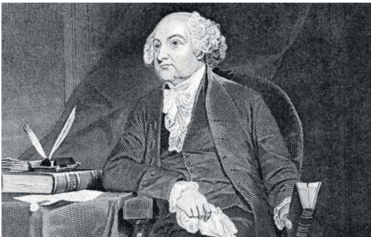
John Adams va passar de ser un defensor de l'Imperi Britànic a ser un convers acèrrim, i va acabar com a segon president dels Estats Units.