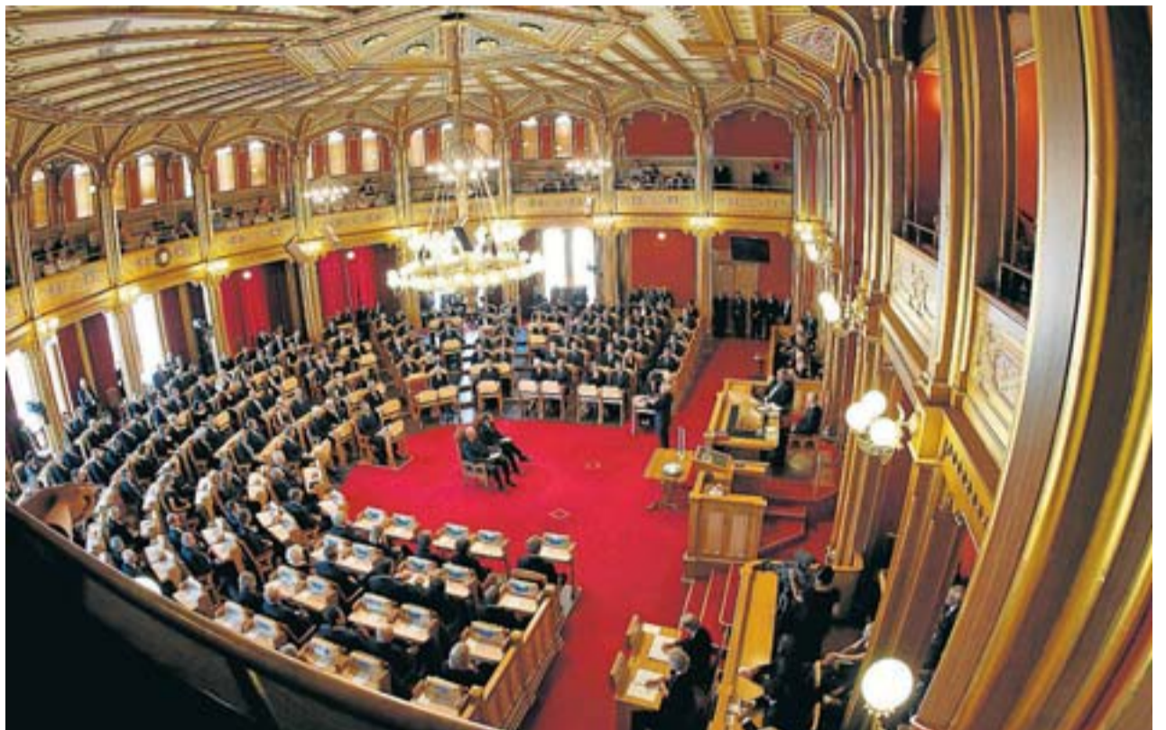
L'interior del Parlament noruec l'agost del 2011, en la cerimònia de record que es va fer un mes després de l'atac terrorista protagonitzat per Anders Behring Breivik, que va matar 77 persones.

I demà Autodeterminació, una paraula màgica