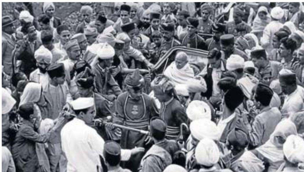
Gandhi va ser el gran líder pacifista que va impulsar la independència índia.

Però, com va succeir amb el desballestament de l'Imperi Espanyol, nombrosos territoris de l'Àsia, del Pròxim Orient i de l'Àfrica també desitjaven descolonitzar-se. Això