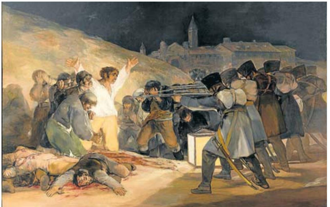
Els pinzells de Francisco de Goya, amb la sèrie Els desastres de la guerra i els quadres sobre l'alçament del 2 de maig del 1808, van contribuir a forjar la idea d'independència i de contraposició amb França.