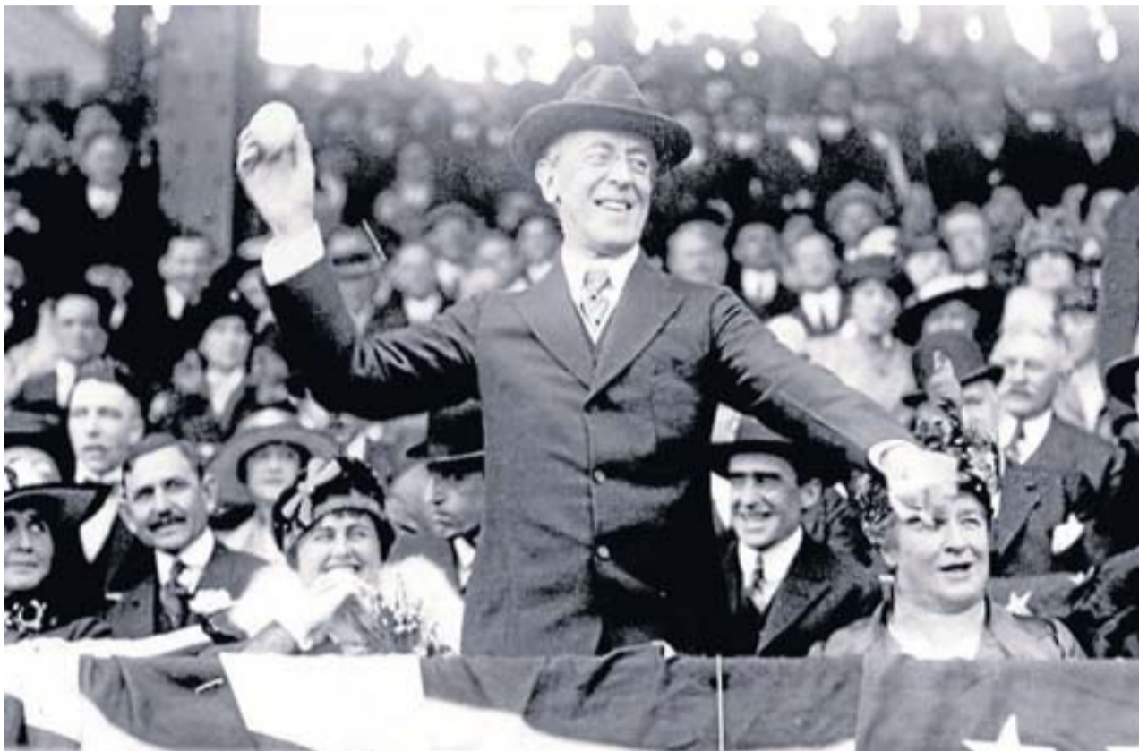
Wilson va posar sobre la taula el concepte d'autodeterminació i va plantejar els famosos Catorze punts per reconstruir Europa després de la Primera Guerra Mundial i evitar futures guerres.

I demà Els estats sorgits de l'Imperi Austrohongarès