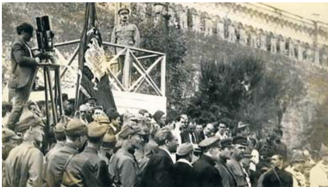
Trotsky passa revista a l'Exèrcit Roig, l'encarregat d'evitar processos secessionistes.

El període incert que va obrir la fi del tsarisme el van voler aprofitar molts moviments nacionalistes insatisfets amb la seva situació política a l'Imperi Rus. Ja des de finals del segle XIX, seguint els aires