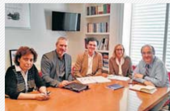
SOCIETAT CIVIL CATALANA

La Junta Electoral de Barcelona ha tombat una demanda del PP que demanava retirar tota la publicitat de la Via Lliure dels Transports Metropolitans de Barcelona. Segons ha pogut saber l'ARA, només un dels cinc membres d'aquest ens creu que la mobilització que impulsa Ara és l'hora sigui un acte electoral i va votar a favor de la prohibició. La resolució al·lega que l'anunci no té la “intencionalitat de captar vots a favor de cap candidatura” i que és “perfectament legítim”.