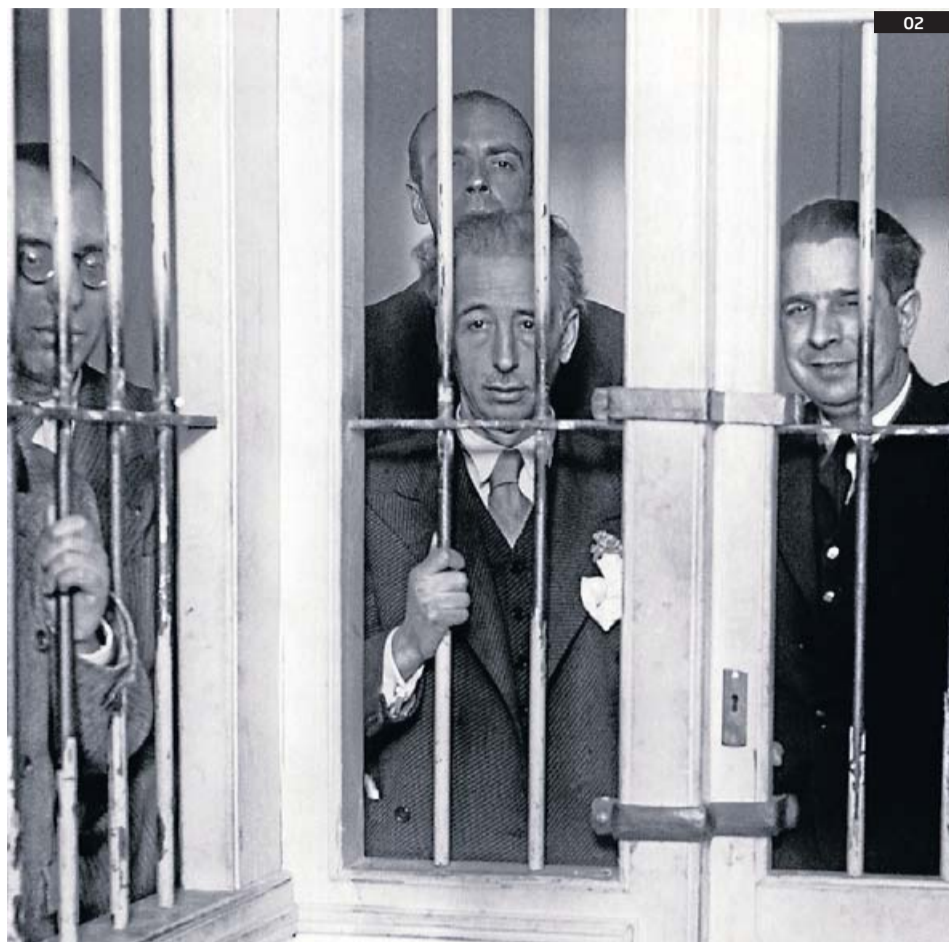
01. Macià, el 27 d'abril del 1931, aclamat a Barcelona 13 dies després de la proclamació. EFE 02. Lluís Companys a la presó després dels Fets d'Octubre. DÍAZ CASARIEGO / EFE