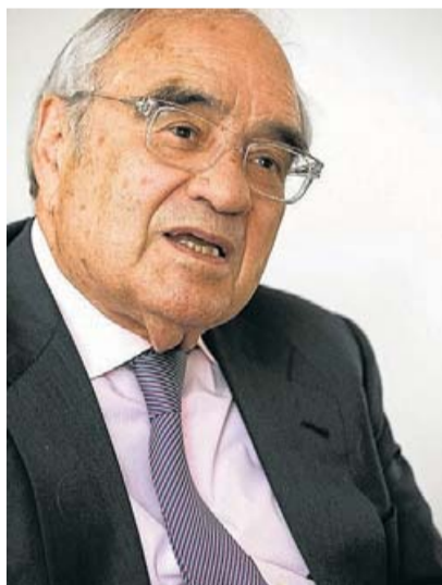
L'exministre franquista Rodolfo Martín Villa.