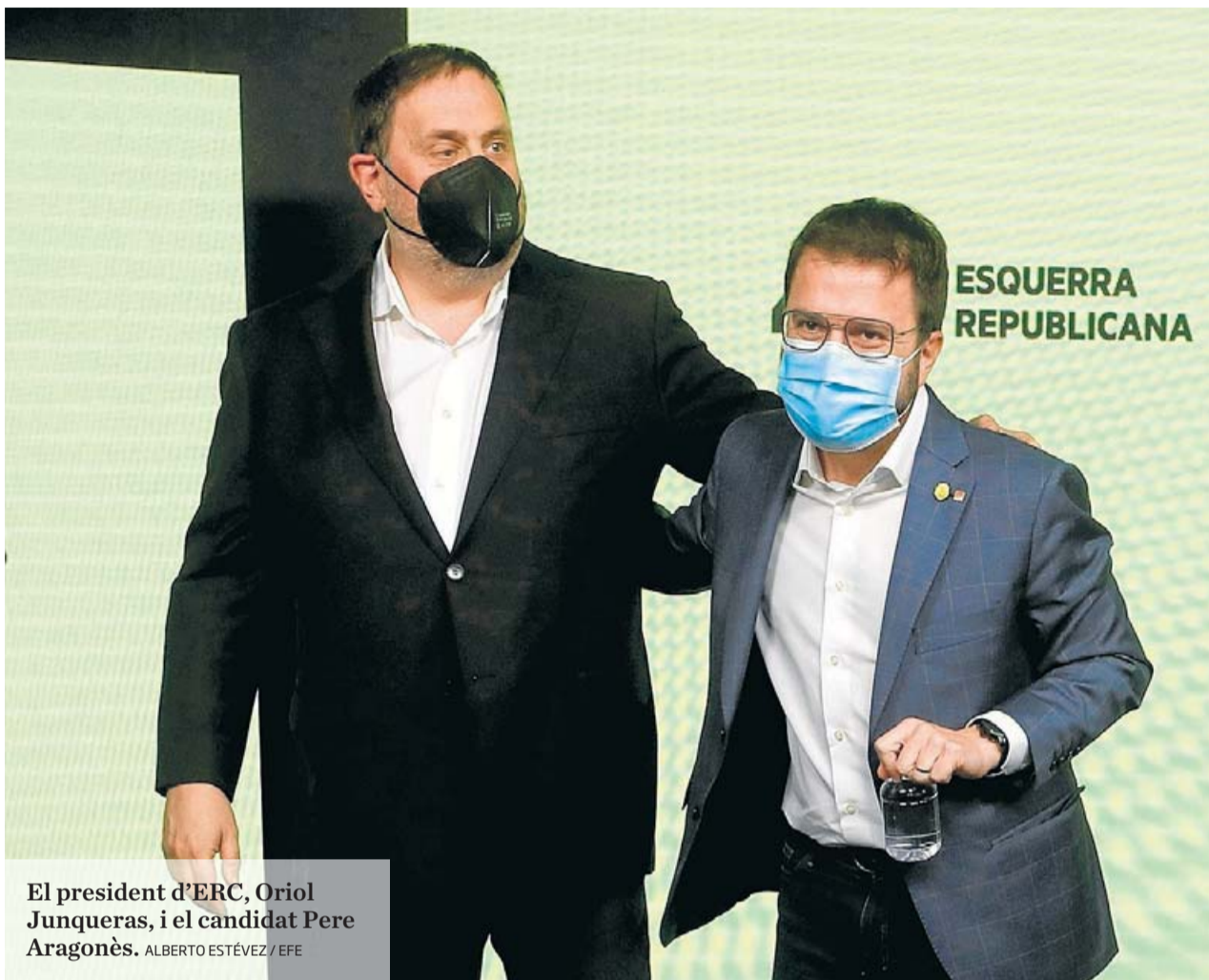
El president d'ERC, Oriol Junqueras, i el candidat Pere Aragonès.